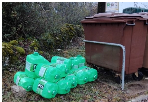
Lotissement La Brousse

Encore des dépôts sauvages sur notre commune :